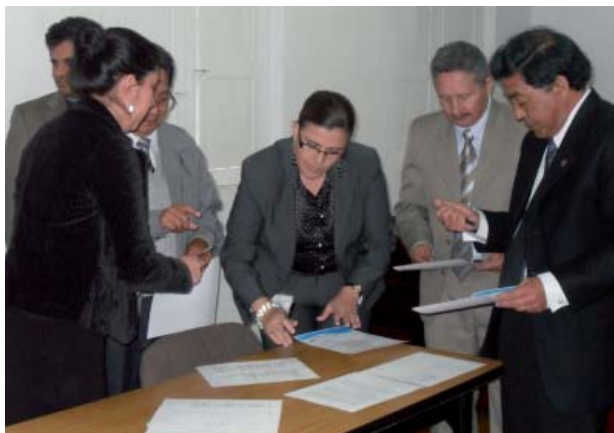
La firma della Dichiarazione di Bogotà

Siriporta di seguito il testo completo del Documento, incluso l'invito ad aderire alla Dichiarazione rivolto ai partecipanti dei precedenti corsi NECOBELAC di formazione di Roma e di São Paulo (Brasile).