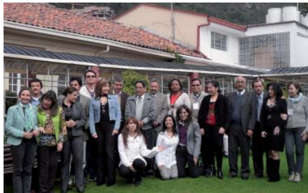
Foto di gruppo dei partecipanti al corso di formazione NECOBELAC di Bogotà

Tutto ciò al fine di contribuire a realizzare un cambiamento culturale frutto del superamento di barriere geografiche ed economiche alla diffusione della conoscenza scientifica in salute pubblica a livello globale. La diffusione della Dichiarazione di Bogotà è promossa in particolare in America Latina con la pubblicazione, sulla Newsletter della Biblioteca Virtual en Salud (BVS) della Pan American Health Organization (PAHO/WHO), del rapporto delle attività del Progetto NECOBELAC svolte in Colombia ( http://espacio.bvsalud.org/boletim.php?articleId=11152306201031 ) (3) (Newsletter VHL, 23 de noviembre, 2010, No. 094 in spagnolo, portoghese e inglese), nonché sul sito web dell'Open Access Directory ( http://oad.simmons.edu/oadwiki/Declarations_in_support_of_OA#2010 ), oltre che sul sito web del Progetto NECOBELAC, nelle quattro lingue del Progetto - inglese, spagnolo, portoghese, italiano ( www.necobelac.eu/documents/Bogota%20Declaration_4_Languages.pdf ). ■