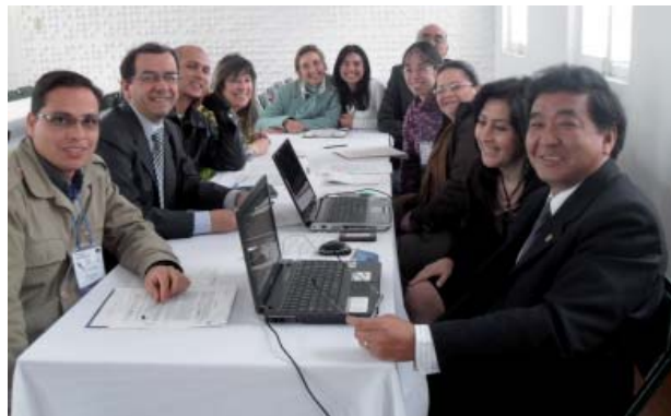
Un momento del lavoro di gruppo durante il Corso NECOBELAC di Bogotà (9-11 novembre 2010)

Nel testo della Dichiarazione è enunciato l'impegno della rete NECOBELAC a promuovere la formulazione e l'adozione di politiche pubbliche in favore della diffusione illimitata della produzione scientifica, a stimolare la qualità della scrittura scientifica, nonché a sostenere l'accesso aperto alla produzione scientifica nei Paesi di appartenenza. Per un'ampia diffusione della Dichiarazione in Italia e, in particolare, presso le istituzioni che hanno partecipato al corso di formazione per formatori NECOBELAC di Roma (18-20 ottobre 2010), è qui pubblicata la Dichiarazione di Bogotà. Lo scopo è di portare a conoscenza di una vasta comunità di operatori di salute pubblica l'impegno condiviso di istituzioni di Paesi europei e latino-americani che operano anche attraverso la rete NECOBELAC a favore delle finalità del Progetto.